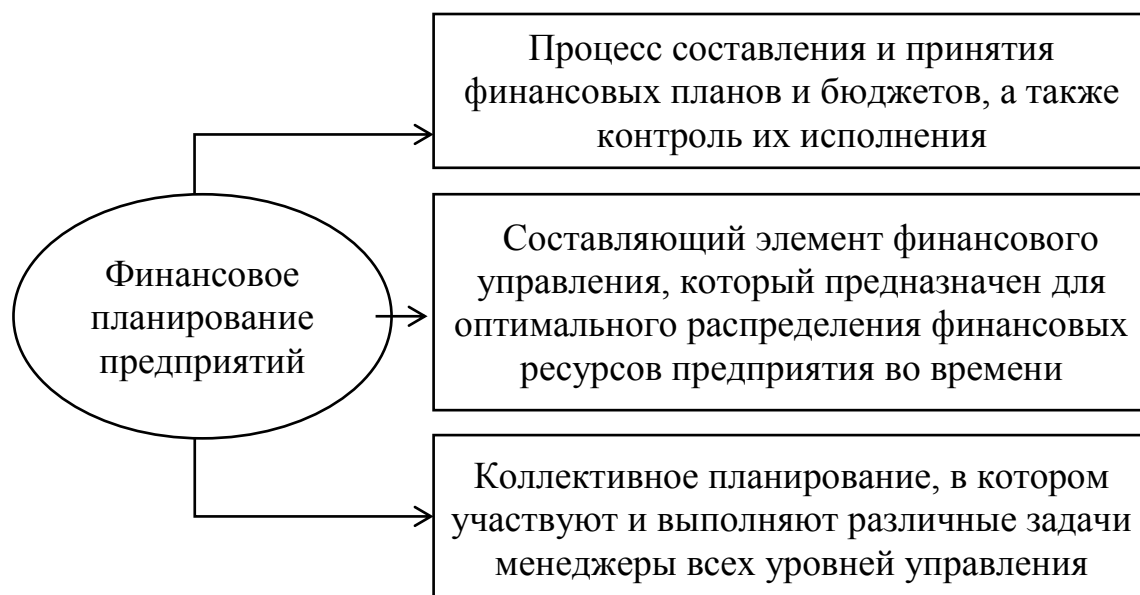
Рис. 1. Подходы к сущности финансового планирования

Следует отметить, что финансовое планирование предприятий – это деятельность по составлению планов формирования, распределения и использования финансовых ресурсов, которая направлена на решение определённых задач для достижения поставленных целей.